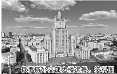
俄罗斯外交部大楼远景。资料图

新华社莫斯科7月31日电(记者 吴刚)俄罗斯外交部7月31日发表评论说,将对欧盟以网络攻击为借口对俄实施的制裁进行反制。