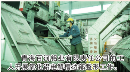
青海百河铝业有限责任公司的工人开展氧化铝电解槽边部整形工作。

青海云天化国际化肥有限公司，一季度各类化肥产品累计产量较去年同期 增幅达5.6% 。