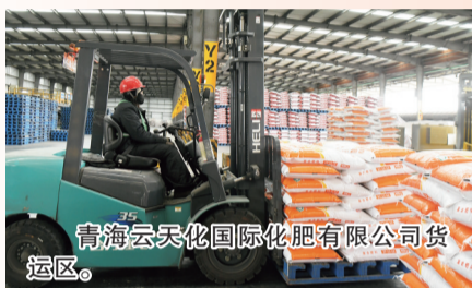
青海云天化国际化肥有限公司货运区。

今年一季度，甘河工业园区实现规模以上工业总产值 181.65亿元 ，同比增长 3.5% ，顺利实现首季开门红。