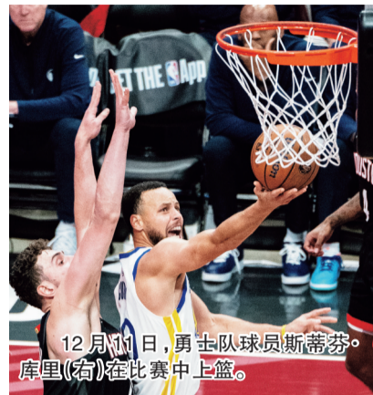
12月11日,勇士队球员斯蒂芬·库里(右)在比赛中上篮。

NBA杯四分之一决赛继续进行,休斯敦火箭队(17胜8负)逆转勇士队获胜晋级。申京得到26分和11个篮板,格林得到12分,他在终场前3.5秒两罚全中帮助球队反超,波兹基斯基的三分绝杀被史密斯封盖,火箭队在主场以91比90险胜金州勇士队(14胜10负)。火箭队拿到2连胜,他们将在半决赛里对阵俄克拉荷马雷霆队。 本报综合消息