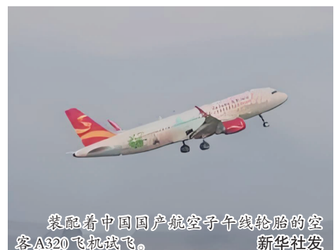
装配着中国国产航空子午线轮胎的空客A320飞机试飞。

记者了解到,此前我国民用航空轮胎基本依赖进口,试飞成功标志着我国已初步具备此类机型轮胎国产保障的能力。 新华社电