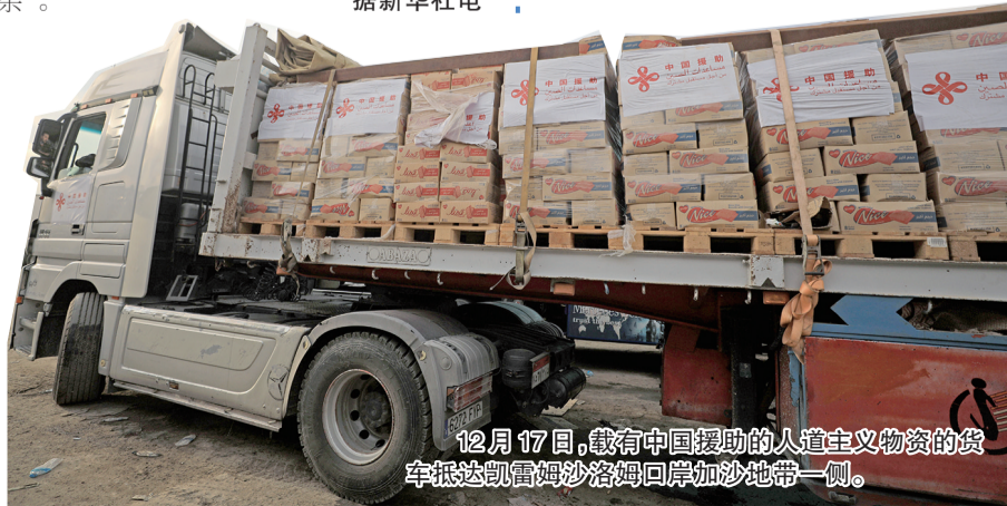
12月17日,载有中国援助的人道主义物资的货车抵达凯雷姆沙洛姆口岸加沙地带一侧。