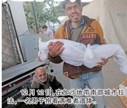
12月12日,在加沙地带南部城市拉法,一名男子抱着遇难者遗体。

美国政府“一边倒”支持以色列的政策也饱受国内批评。美国全国广播公司日前公布的民调显示,56%被调查者不支持美国政府应对本轮巴以冲突的方式。