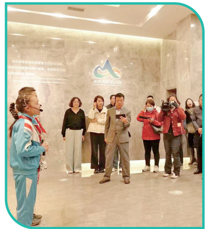
小小讲解员为游客讲解。