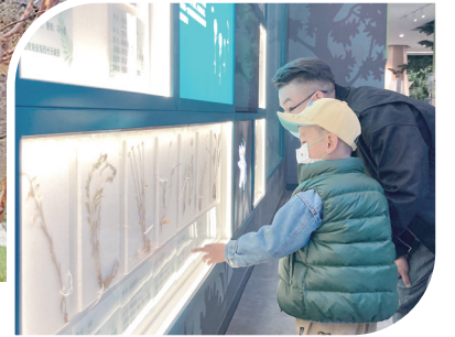
→ 游客参观生态科普馆。