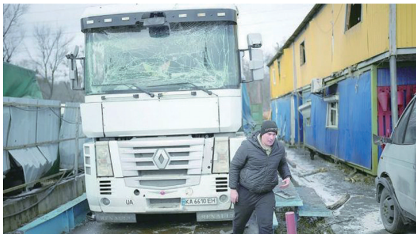
乌克兰方面称其境内能源基础设施26日遭受“大规模空袭”。图为基辅一座发电厂附近遭袭后的场景。

这一决定在欧洲也受到质疑。意大利副总理、外交与国际合作部部长塔亚尼25日表示,欧盟没有真正的外交和国防政策,总是跟在美国人后面,并最终为美国的利益服务。法新社称,乌克兰要求西方盟友提供更多武器的声音在法国左派中受到冷遇,他们担心拥有核武器的俄罗斯受到刺激而出现战争升级。