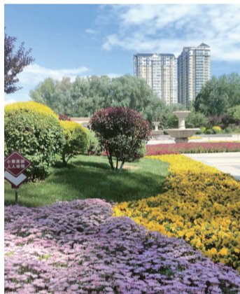
↑ 西宁秋景。