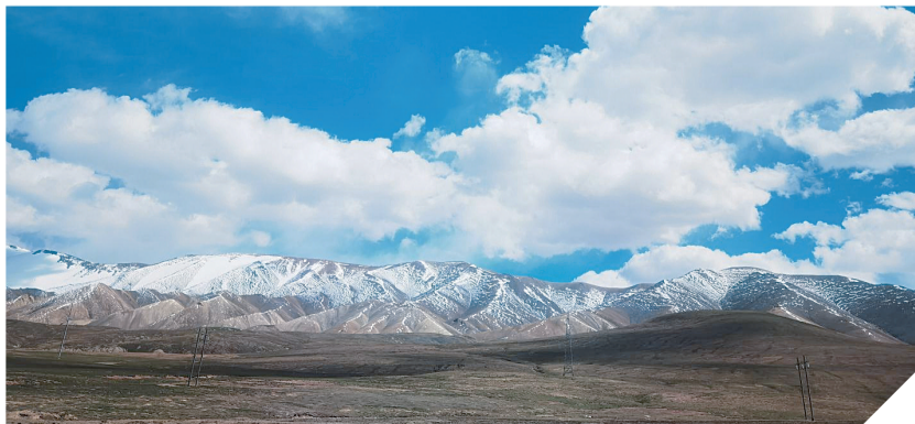
↓ 神秘可可西里。乔红英 摄