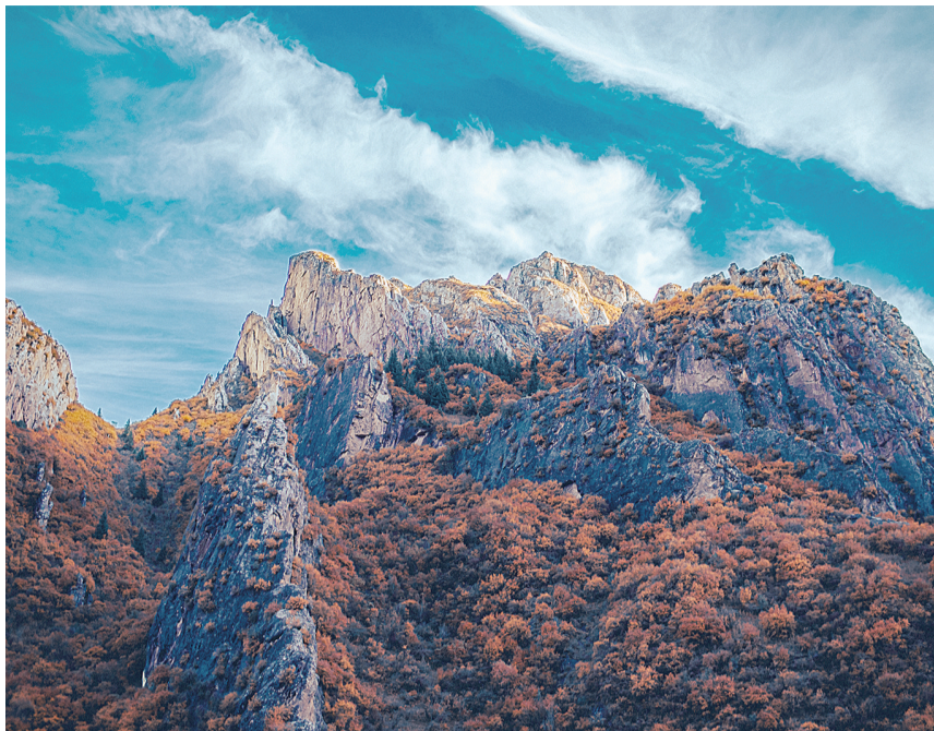
囊谦娘拉峡谷。

10月12日,由省委网信办指导、西海都市报社主办的“绿水青山家乡美”手机随拍活动启动后,吸引了众多读者、网友、摄影爱好者的关注,截至15日,西海都市报客户端已收到大量精彩的摄影作品和视频作品。众多读者、网友纷纷分享作品,图说家乡美,点赞青海美。