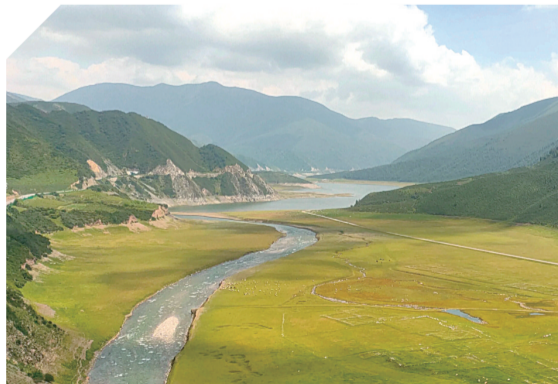
↓ 大通黑泉水库。