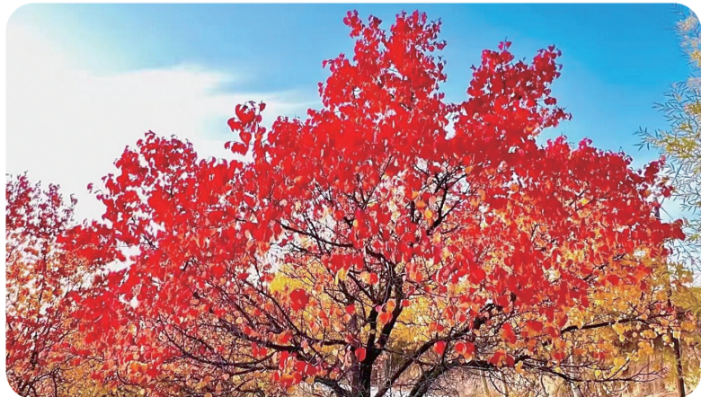
↓ 民和马营美景。