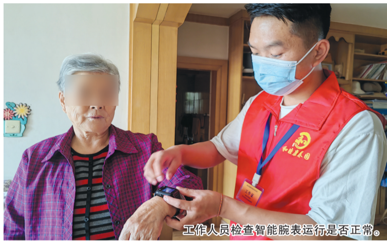
工作人员检查智能腕表运行是否正常。

下一步,市民政局将全面开展家庭养老床位建设和服务,逐步将服务范围扩展至全市,并鼓励探索将政府购买养老服务资金与家庭照护床位服务补贴资金统筹使用,进一步减轻老年人负担。