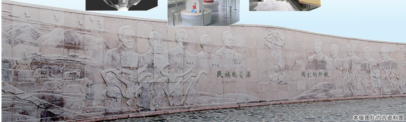
本版图片均为资料图