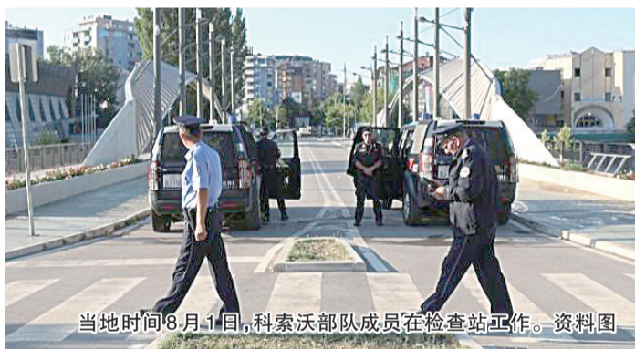
当地时间8月1日,科索沃部队成员在检查站工作。资料图

科索沃原计划1日起采取名为“法律和正义”的行动,废除所有由塞尔维亚颁发的身份证件和车辆牌照。塞尔维亚对此十分不满,军队进入戒备状态。俄罗斯怒斥,这是将塞尔维亚人逐出科索沃的又一步行动。北约主导的“科索沃和平实施部队”则表示,准备好依照联合国授权进行干预。