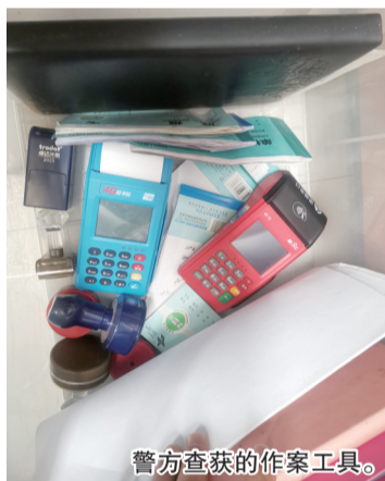
警方查获的作案工具。