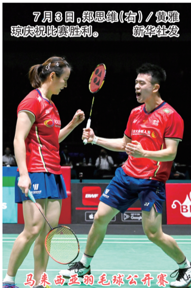
7月3日,郑思维(右)/黄雅琼庆祝比赛胜利。