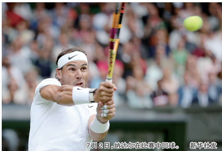
7月2日,纳达尔在比赛中回球。

另外,中国新秀郑钦文以0比2不敌哈萨克斯坦的17号种子莱巴金娜,继张帅之后止步32强。第二周的单打赛场将没有中国球员身影。