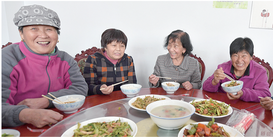
3月30日中午,西宁市二十里铺镇二十里铺村爱老幸福食堂内,老人们正在就餐。据了解,近年来西宁市大力建设社区爱老幸福食堂的同时,也为农村老年人同步开展助餐服务,农村爱老幸福食堂让老年人幸福感大大增强。