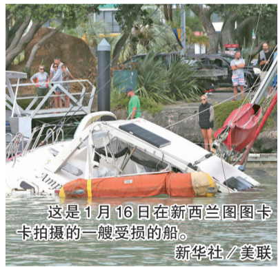
这是1月16日在新西兰图图卡卡拍摄的一艘受损的船。

新西兰总理杰辛达·阿德恩16日也说,由于火山灰污染水源,淡水可能成为汤加居民的急需品。 新华社特稿