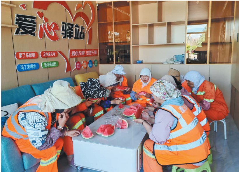
环卫工人在爱心驿站休息。

高原的冬季漫长且酷寒。凛冽的寒风、极低的气温，是环卫工人、快递员、生态管护员等户外劳动者每日都要直面的考验。一处能遮风挡雨、歇