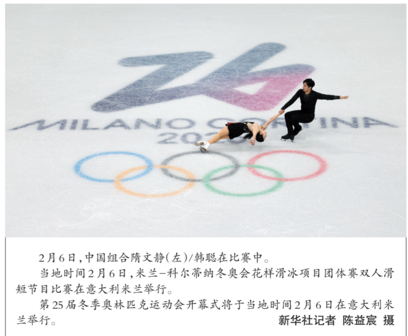
2月6日，中国组合隋文静(左)/韩聪在比赛中。当地时间2月6日，米兰-科尔蒂纳冬奥会花样滑冰项目团体赛双人滑短节目比赛在意大利米兰举行。第25届冬季奥林匹克运动会开幕式将于当地时间2月6日在意大利米兰举行。