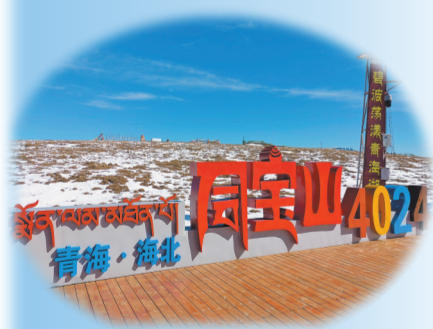
海拔4024米的同宝山，如今已成为网红打卡地。

同宝山，这座被《金瓶似的小山》传唱过的高原山峰，如今正以承载神话传说、生态之美、英雄荣光与旅游活力的崭新姿态，迎接来自五湖四海的游客，让歌声中的眷恋与热爱，在新时代的发展篇章中不断延续、升华。