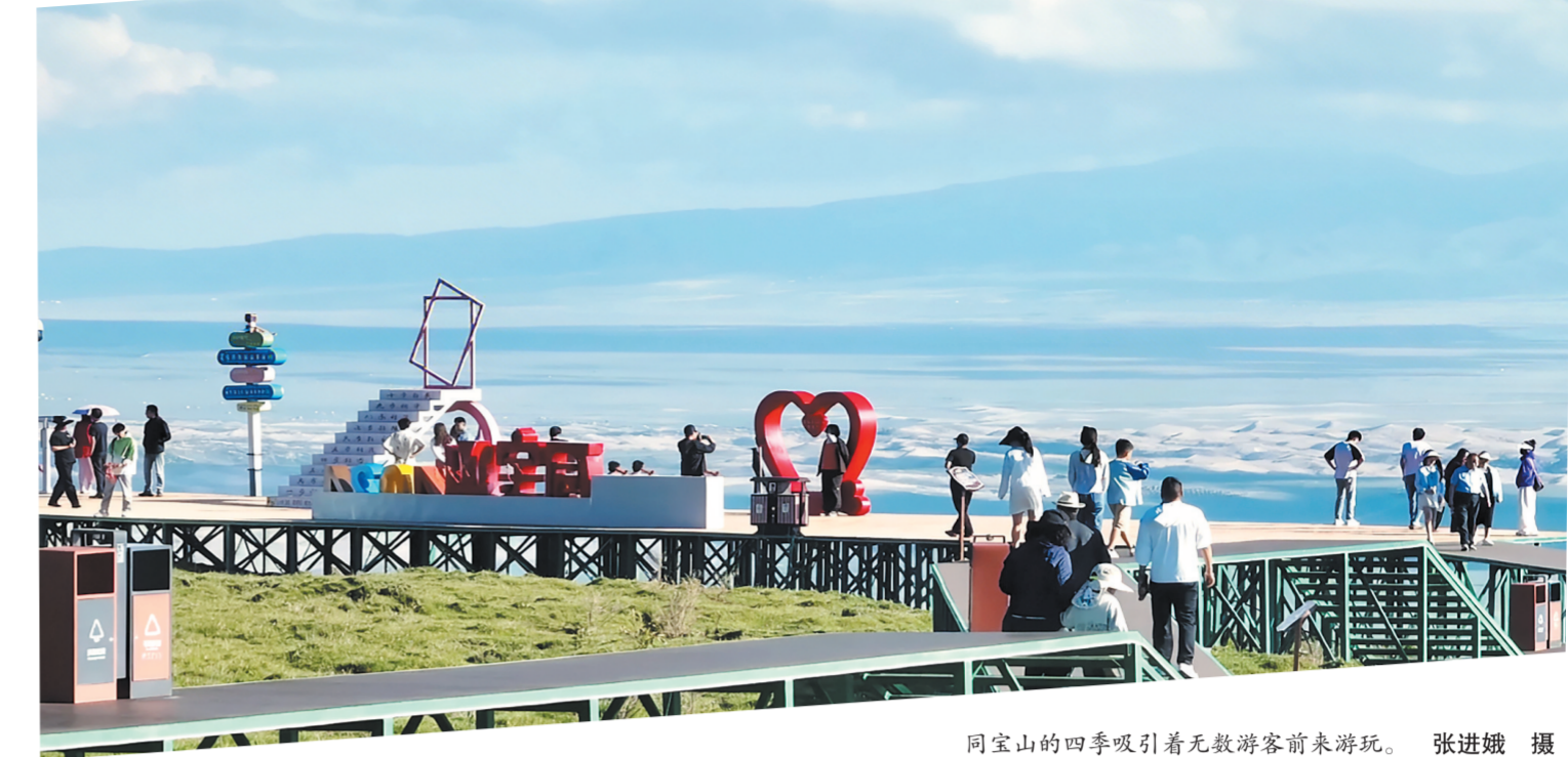
同宝山的四季吸引着无数游客前来游玩。

露梅竞相绽放，金灿灿、白茫茫的花朵点缀在翠绿的草原上，微风拂过，花海泛起层层涟漪，引得蜜蜂和蝴蝶在花丛中翩翩起舞。