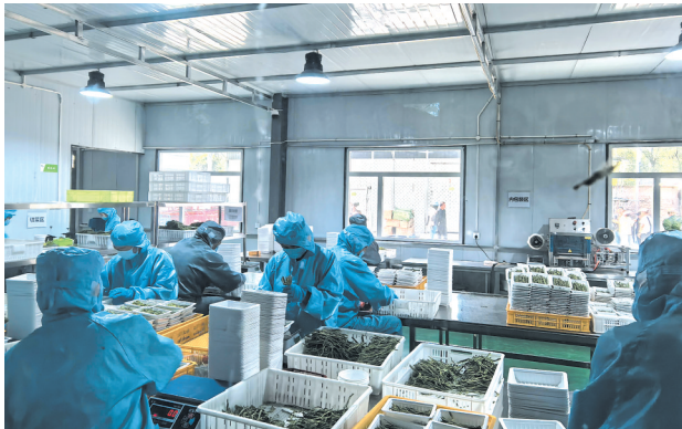
王屯村贡菜加工厂内忙碌的工人。