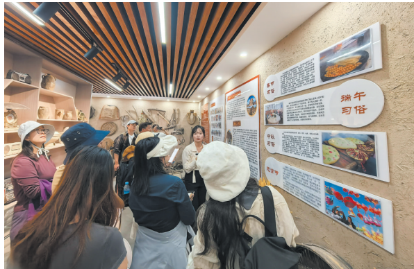
参观上刘屯村村史馆。