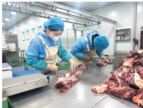
本报记者 王晶 丁玉梅 何娟娟