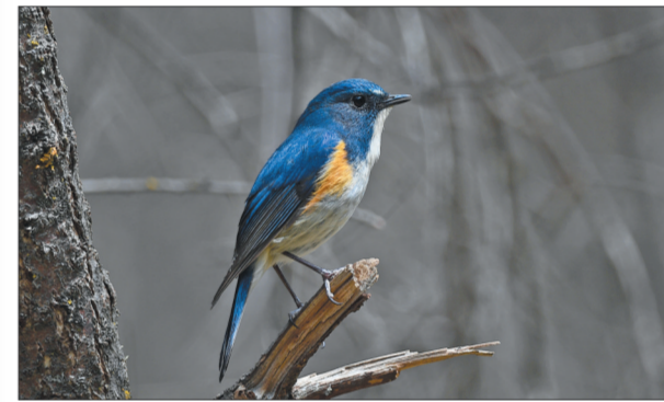
休憩的祁连山蓝尾鹨