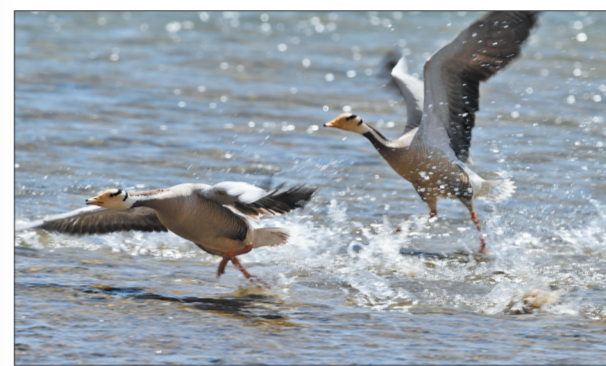
湖面翱翔的斑头雁