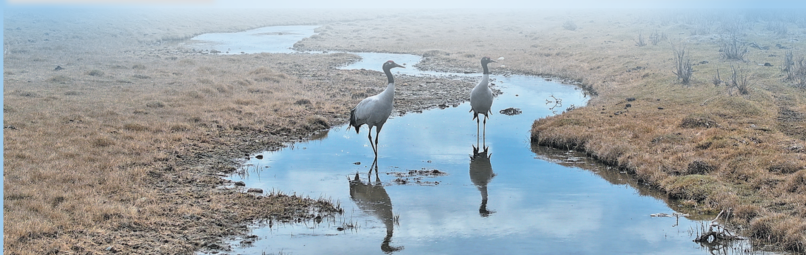
央隆湿地公园内黑颈鹤夫妇觅食