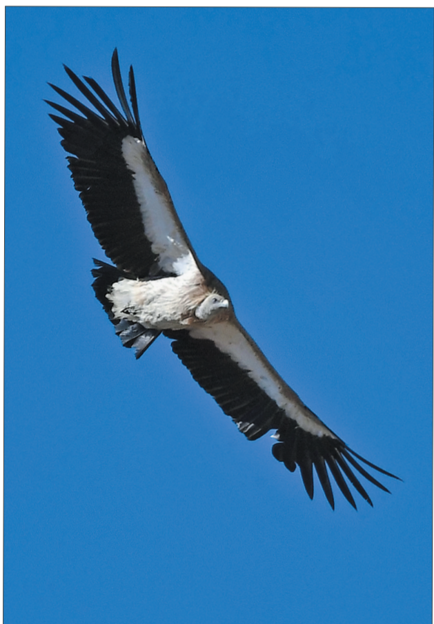
高山秃鹫翱翔于苍穹