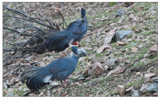
林间觅食的蓝马鸡