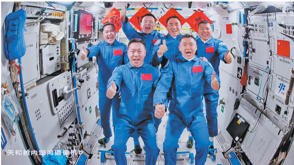
4月25日在北京航天飞行控制中心拍摄的神舟二十号航天员乘组和神舟十九号航天员乘组“全家福”。

新华社酒泉4月24日电(记者 李国利 黄一宸) 神舟二十号载人飞船发射4月24日取得圆满成功,中国载人航天在“东方红一号”发射55载之际开启第20次神舟问天之旅。