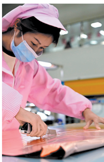
企业工人工作严谨。

新时代同心逐梦，新征程凯歌以行。巾帼逐梦的坚定身影，将凝聚起青海妇女儿童事业奋力前进的铿锵步伐。站在历史的新起点，全省各级妇联组织将继续深入贯彻落实习近平总书记重要讲话精神，以自我革新、时不我待的精神坚定推进新时代党的妇女工作取得新成就，为奋力谱写中国式现代化青海篇章贡献巾帼力量。