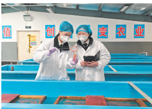
西宁海关检查出口产品。