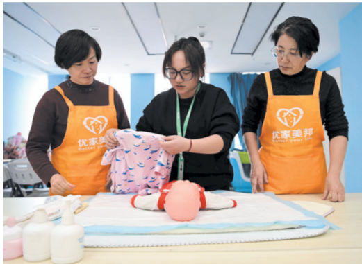
家政服务细致入微。