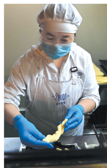
面点师在制作可口食品。