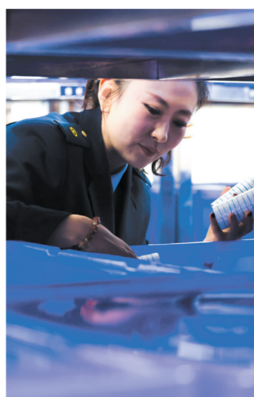
西宁客运段库管员保障后勤。