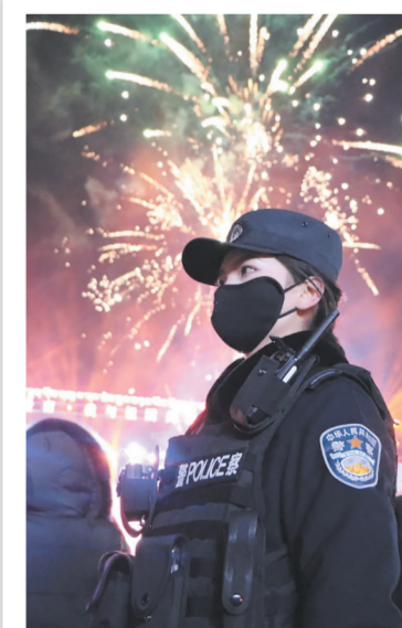
公安女警正在执勤。