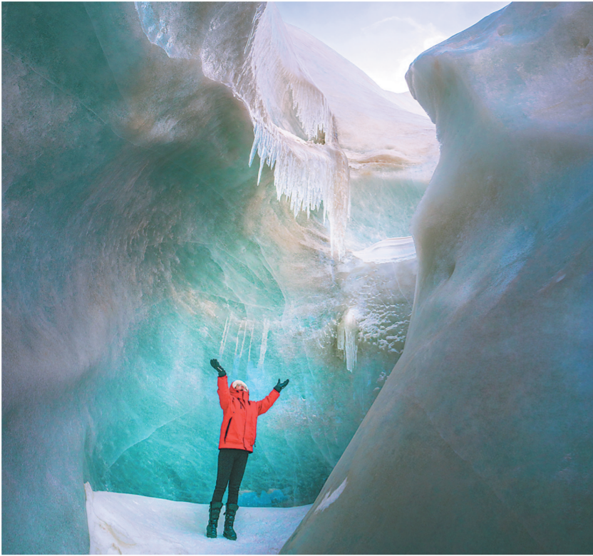
随着海西蒙古族藏族自治州冬春季旅游系列活动拉开帷幕，地处柴达木盆地北缘、祁连山系吐尔根达坂山东端的敦德冰川成为众多越野和摄影爱好者的诗与远方。敦德冰川又称敦德冰帽，是西北地区最大的平顶冰川，面积达57.07平方公里，其顶部海拔达5290米。图为游客拍照。

今年以来，我省通过整合生态旅游资源，优化推出多条生态文化旅游带，实施“山清水秀·大美青海”文化旅游品牌提升行动，打造高原湖泊、盐湖风光、草原花海等生态旅游打卡地，开发高原康养、生态研学、自然教育等生态旅游线路和产品，提质提升基础设施、产品业态、接待服务等，推动文化