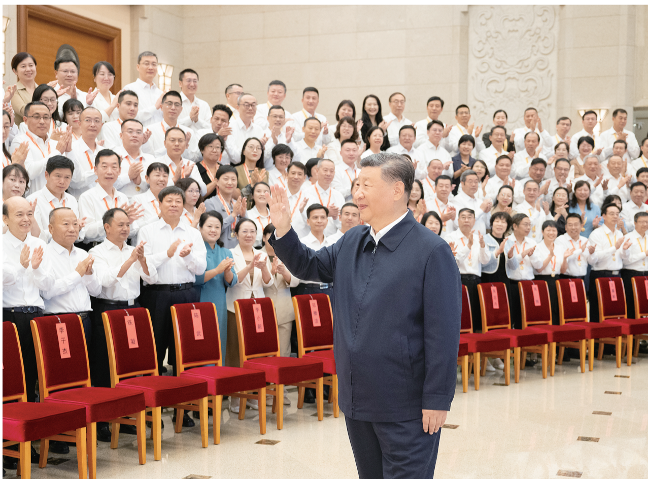
九月九日,党和国家领导人习近平、李强、蔡奇、丁薛祥等在北京接见参加庆祝第四十个教师节暨全国教育系统先进集体和先进个人表彰活动代表。

新华社北京9月10日电 全国教育大会9日至10日在北京召开。中共中央总书记、国家主席、中央军委主席习近平出席大会并发表重要讲话。他强调,建成教育强国是近代以来中华民族梦寐以求的美好愿望,是实现以中国式现代化全面推进强国建设、民族复兴伟业的先导任务,坚实基础、战略支撑,必须朝着既定目标扎实迈进。