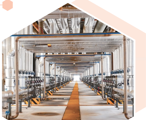
←盐湖股份子公司蓝科锂业生产线。

今年,在青海最好的季节,记者走进察尔汗盐湖,在这片全国“含盐量”最高的地方,来探寻这里高“含质量”如何打造?逆境下,又如何苦做内功,将“创新”“质优”“先进生产力”落到实处?