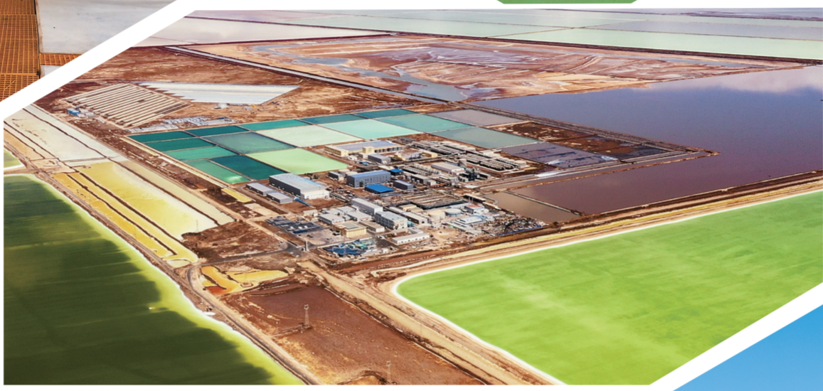
察尔汗盐湖生产区。