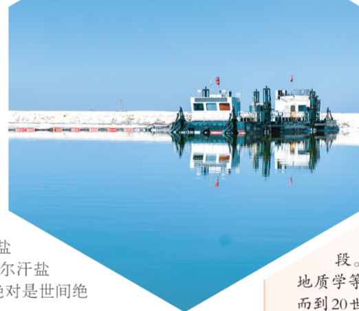
→察尔汗盐湖上游戈着采盐船。