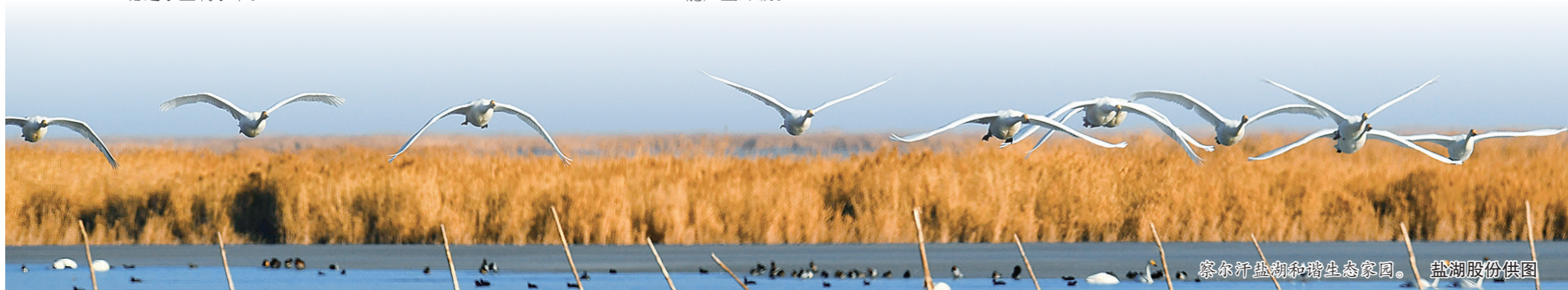
察尔汗盐湖和湖生态家园。