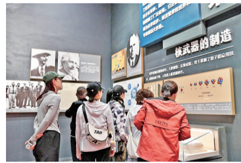
游客参观原子城纪念馆。