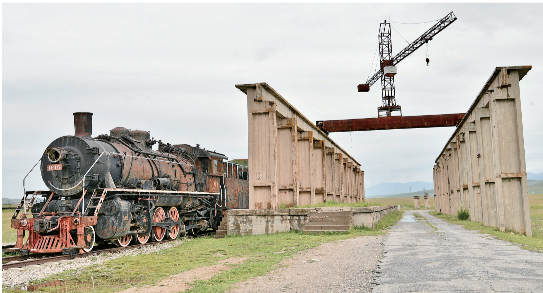
十一厂区危险品站台。