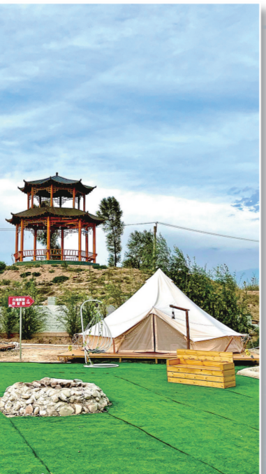
九曲里乡村旅游点。