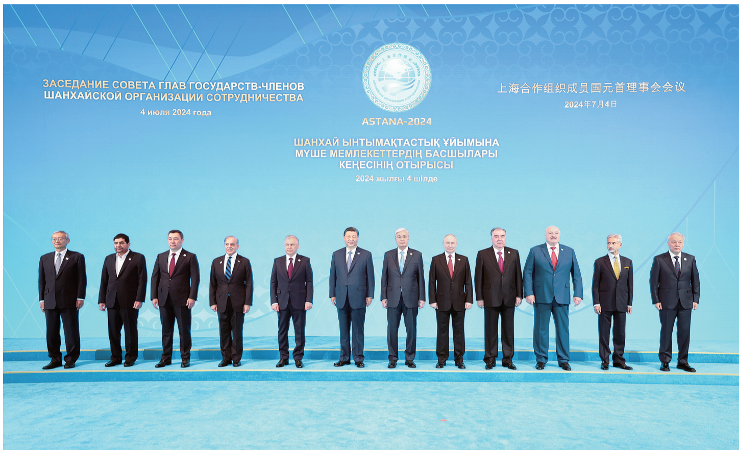
当地时间7月4日上午,国家主席习近平在阿斯塔纳独立宫出席上海合作组织成员国元首理事会第二十四次会议。这是习近平同上海合作组织成员国领导人集体合影。