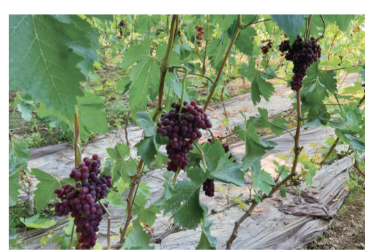
葡萄挂满枝头。

自果蔬试验基地投入运营以来,自产的葡萄、火龙果、西瓜、辣椒、甘蓝、菜瓜、萝卜等十余种新鲜果蔬摆上了当地人的餐桌,不仅满足了牧民群众对果蔬多样化的需求,更在一定程度上形成了市场竞争效应。2023年,基地共生产各类果蔬1.2万公斤,实现收益13万余元。