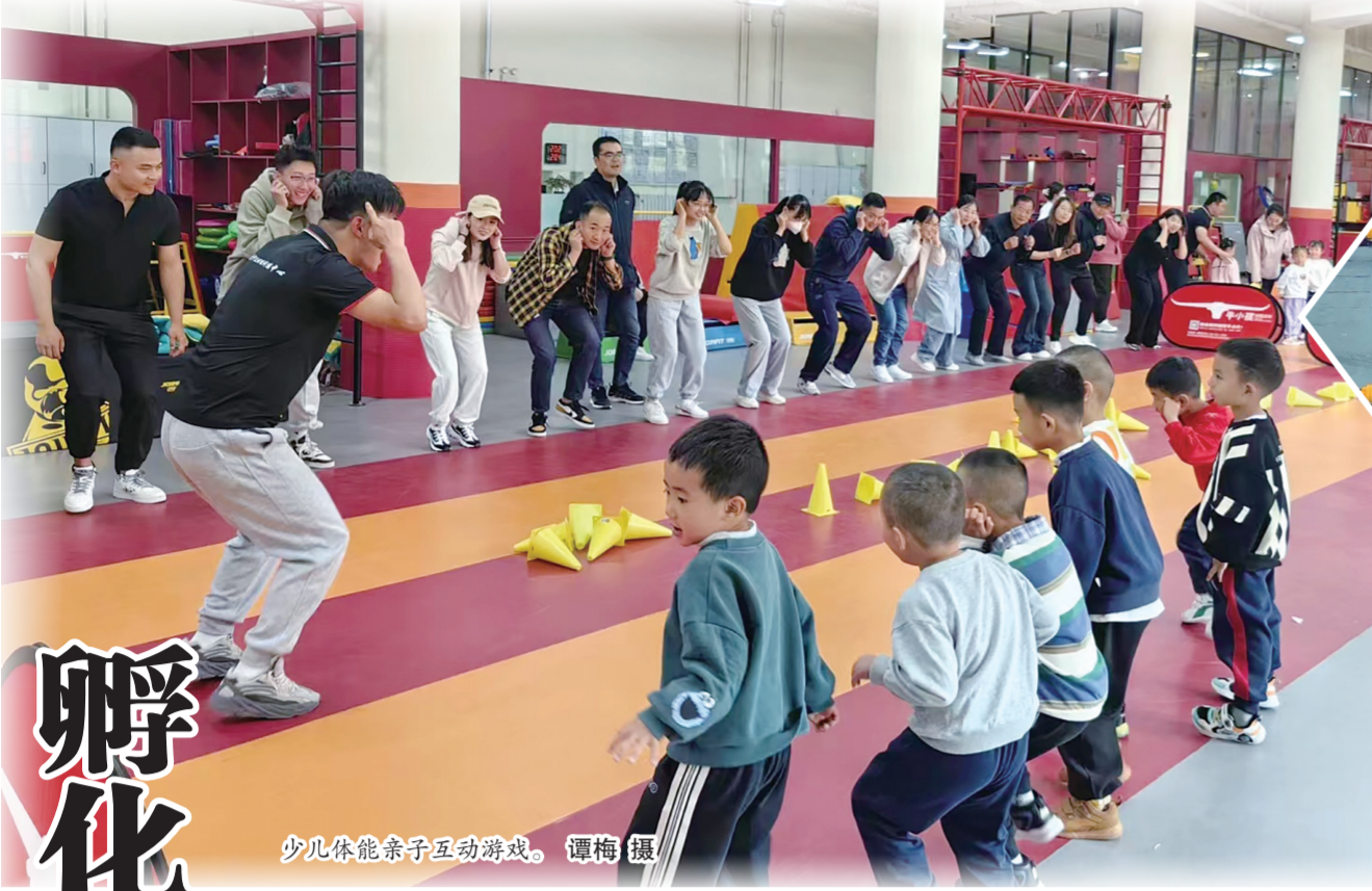
少儿体能亲子互动游戏。