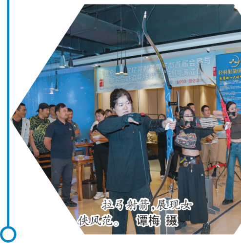
挽弓射箭,展现女侠风范。