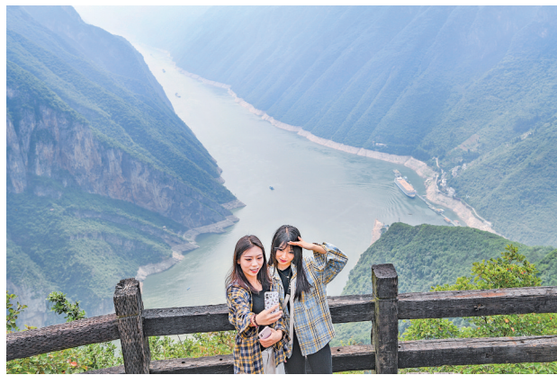
5月16日，游客在重庆市巫山县巫峡·神女景区守望台留影。