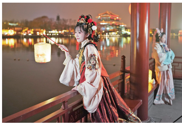
游客在西安大唐芙蓉园拍照游玩(2024年2月2日摄)。近年来，国潮国风成为年轻人新宠。在古城西安，汉服爱好者们精心打扮，在大街小巷拍照“打卡”，乐享古风新韵。