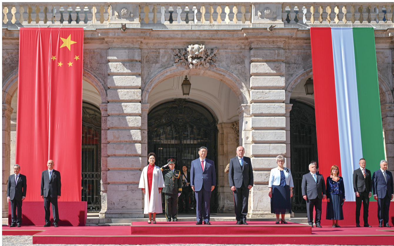
当地时间5月9日上午,国家主席习近平在布达佩斯出席匈牙利总统舒尤克和总理欧尔班共同举行的隆重欢迎仪式。