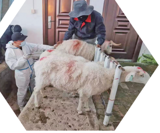
开展藏羊人工授精试验。