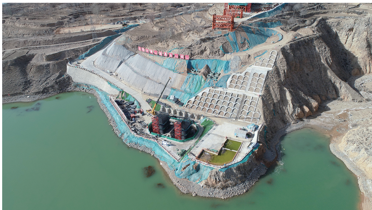
西成铁路建设现场。

“项目全机组投产,预计平均年发电量达73.04亿千瓦时,可满足182.5万个年用电量为4000千瓦时的家庭用电需求,每年可节约标准煤约220万吨,减少排放二氧化碳