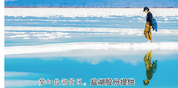
梦幻盐湖景区。盐湖股份提供