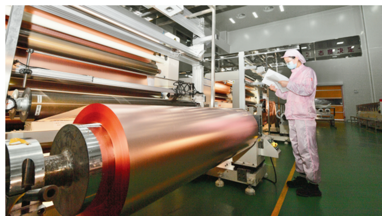
不断提升企业核心能力、竞争优势、经营效益，为青海经济高质量发展添砖加瓦。