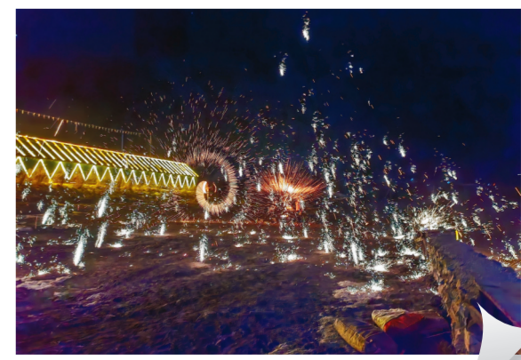
“打铁花”表演。