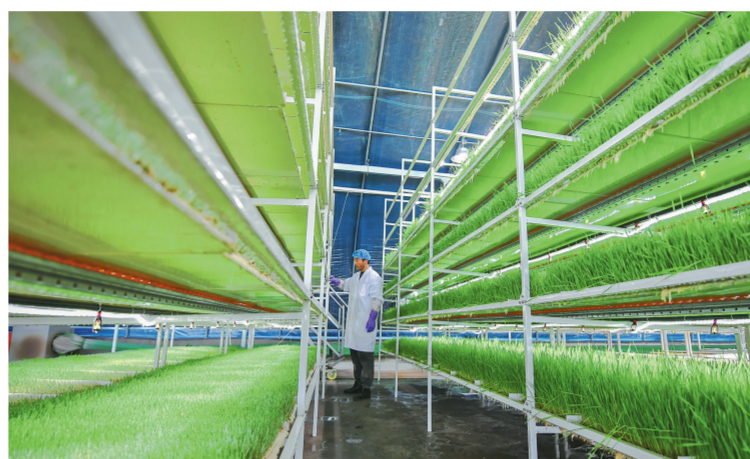
牧草无土栽培为经济发展注入新活力。