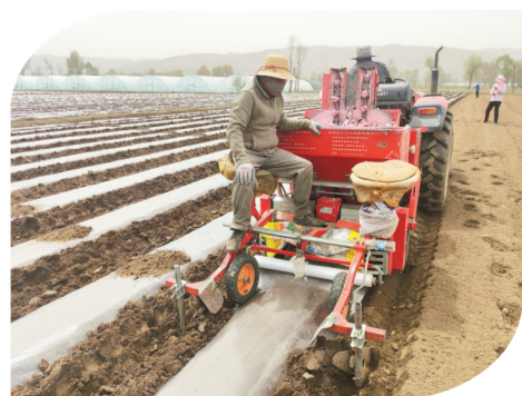
马铃薯播种覆膜。

注册“圣域”商标区域公用品牌,及“云谷红”“隆口”“深眼窝”“庄稼汉”“壮指头”等企业商标;20万亩马铃薯生产基地被批准为全国绿色食品原料标准化生产基地,全部实现马铃薯绿色生产;湟中区云谷川马铃薯基地入选第二批全国种植业“三品一标”基地名单,经营主体随之壮大,带动全区马铃薯外销到甘肃、宁夏、云南、贵州、内蒙古等省区,鲜薯销售量约15万吨,实现产值达3亿元。