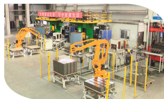
镁碳砖加工生产线。