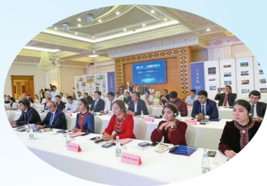
青海土库曼斯坦经贸推介会现场。

对外贸易高速增长,跑出发展“新速度”;“走出去”的步伐愈加稳健,展现对外开放“新潜力”……2023年,深居内陆的青海固本培元、逆势进位,外贸、外资、外经“三轮驱动”,带动全省高水平对外开放,为青海在推进中国式现代化建设中提供有力支撑。