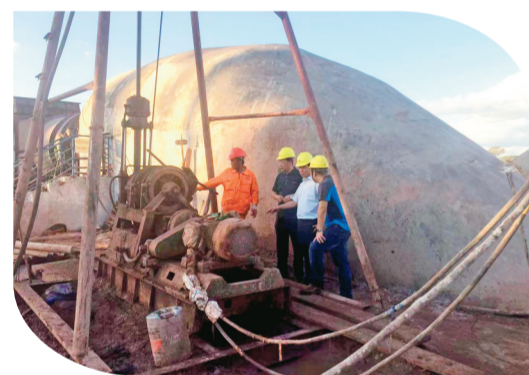
青海省核工业地质局连续15年在老挝各省市开展测量、钻探、物探、地质、化验等综合钾盐矿勘探工作。