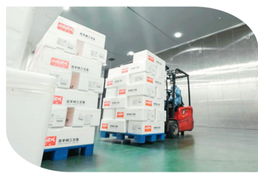
即将出口国外市场的青海冰鲜三文鱼产品。夏思远 摄