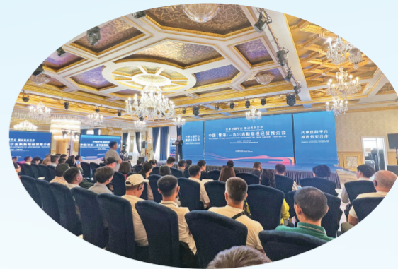
2023中国(青海)吉尔吉斯斯坦经贸推介会。