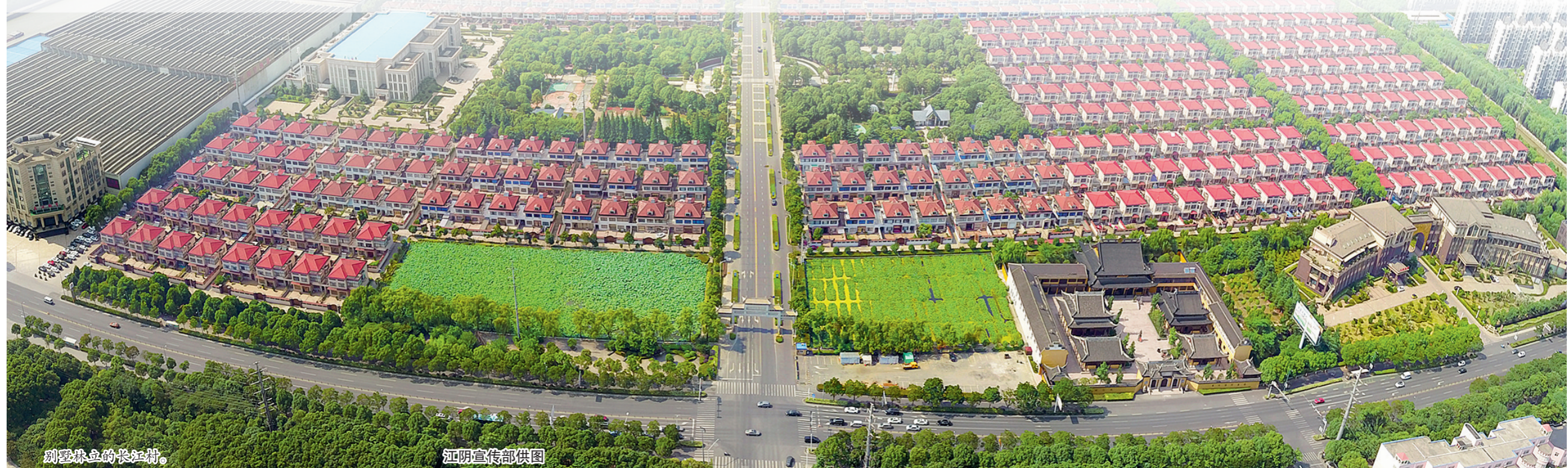
别墅林立的长江村。

长江村共同富裕的成功实践在于富民惠民,依托不断壮大的村集体经济,让村民与村企成为共同体,形成一荣俱荣一损俱损的局面,让更多群众参与发展全过程,让更多群众享受发展红利,不断提升福利水平,让共同富裕之花常开长盛。