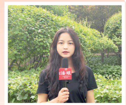
本报记者杨文花进行现场报道。