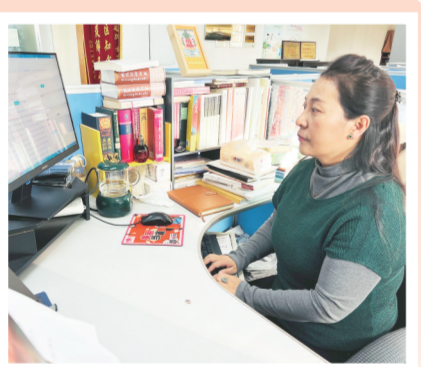
本报记者索南草工作中。