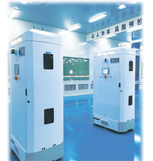
国家电投黄河公司西宁太阳能分公司IBC电池制造车间内的运输机器人。

登上产业高峰，亚洲铝业的目标更加鲜明：全力践行创新驱动发展战略，以减碳为抓手，赋科技创新之力，在绿色制造上达到新高度，大力推进智能制造，在能耗和产品质量上全面超越国际一流竞争对手。为地方跨越发展增添更多绿色增长经济“新引擎”，为人类提供清洁能源，为我国半导体产业崛起添砖助力。