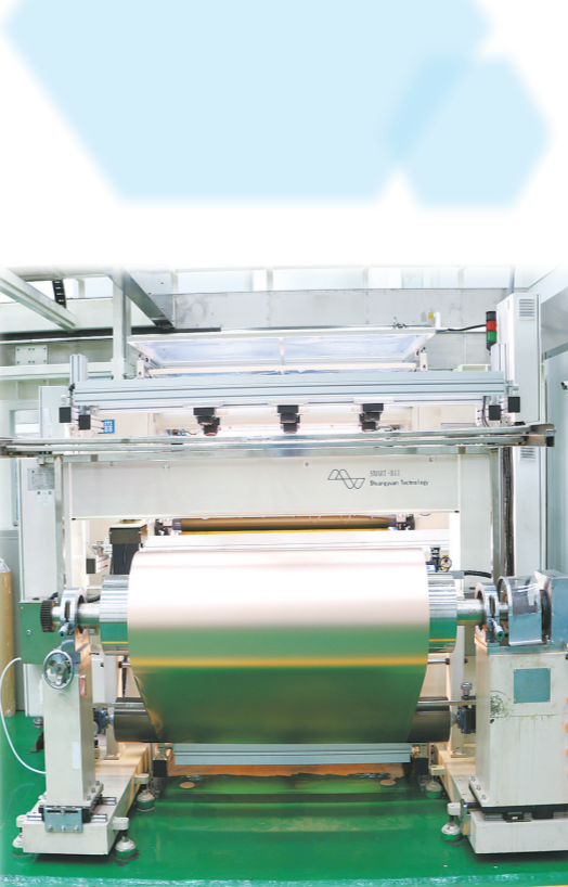
青海诺德新材料有限公司的分切车间。