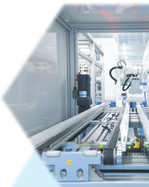
国家电投黄河公司西宁太阳能分公司IBC电池制造车间内的扩散工序上料台。

一分耕耘，一分收获。据了解，西宁太阳能分公司生产的IBC电池组件产品，已远销瑞士、法国、意大利、德国、西班牙、比利时等国家。不仅如此，还探索实践“光伏+”、绿能替代、智慧电站、零碳园区等新业态、新模式，围绕产业链部署创新链，全方位支撑清洁能源高质量发展。