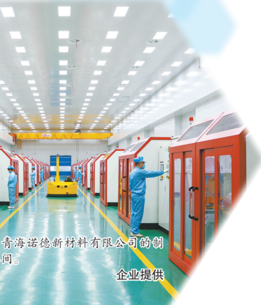
青海诺德新材料有限公司的制箔车间。