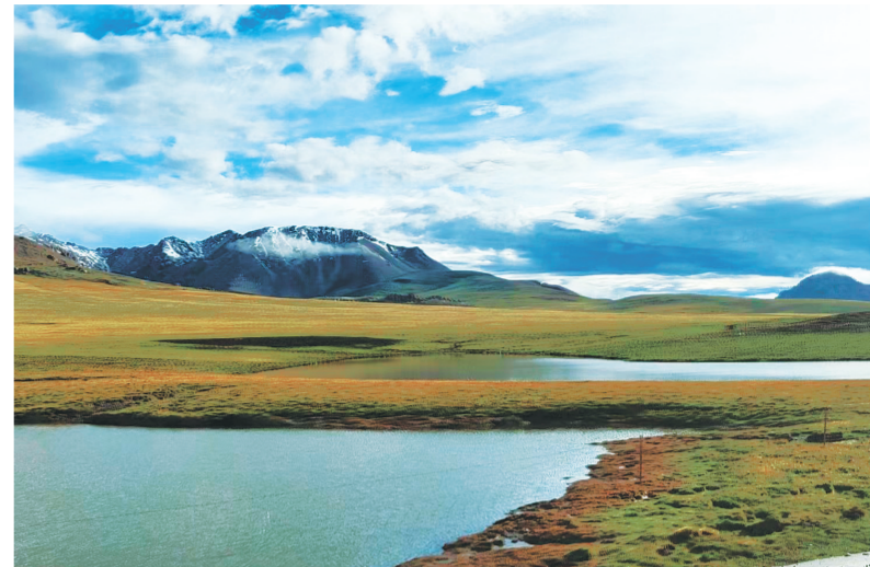
索加乡内风景如画。