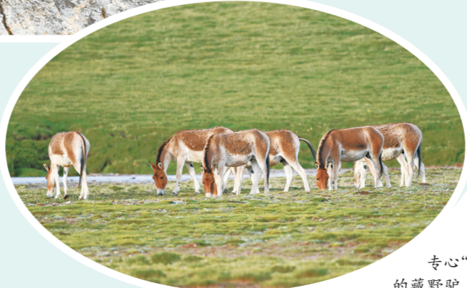
专心“干饭”的藏野驴。