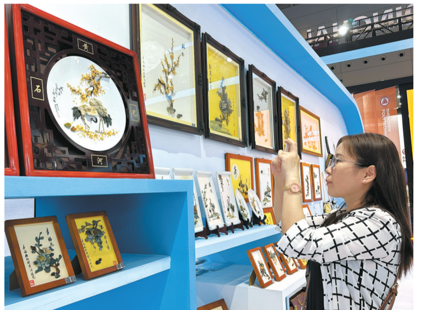
精美的黄河石艺画吸引观众驻足。

省文化和旅游厅将立足新机遇、新挑战，指导各地加强对自驾车旅居车营地的规范管理和有序发展，引导营地提高服务质量，优化产品供给，不断深化自驾车旅居车线路与产品设计，培育行业创新机制，加强市场宣传和针对性服务，更好地满足更多自驾车旅游爱好者的新需求新选择新体验，助力国际生态旅游目的地建设。