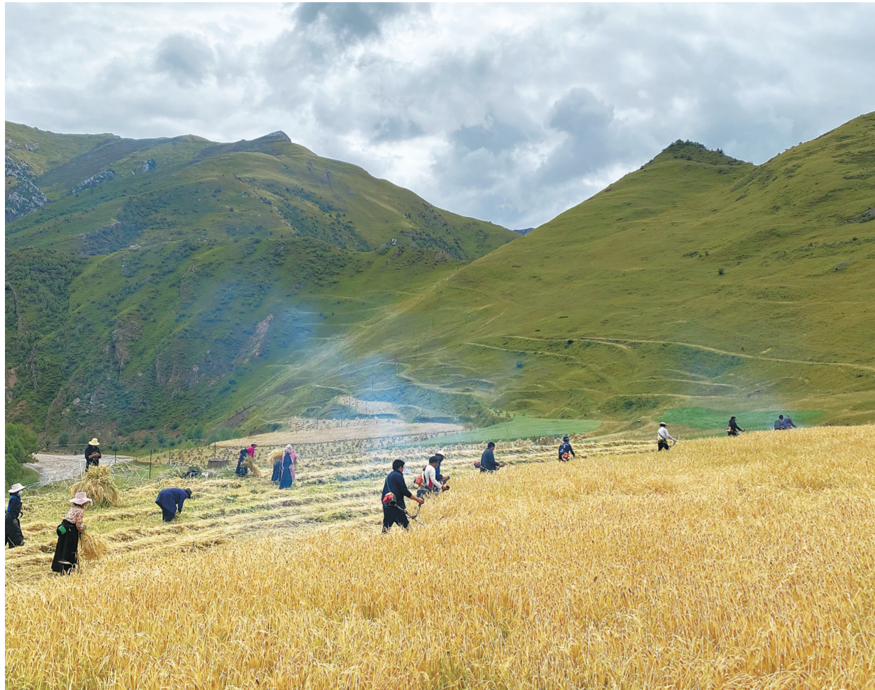
青稞成熟一片金黄。