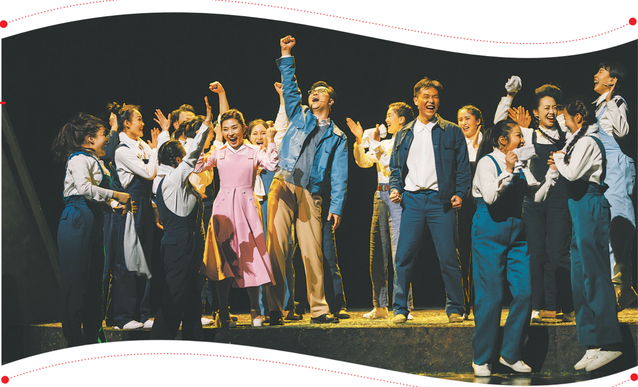
本文图片均为歌剧《青春铸剑221》剧照。