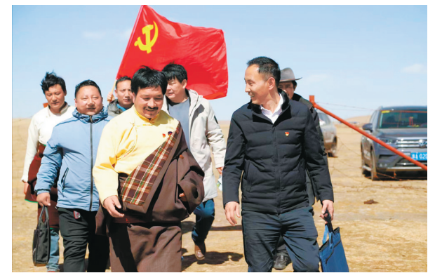
海南藏族自治州充分调动各级各类宣讲队伍力量，走村入户开展分层次、分批次的宣讲活动，全面深入推进党的二十大精神在基层走深走实、落地见效。