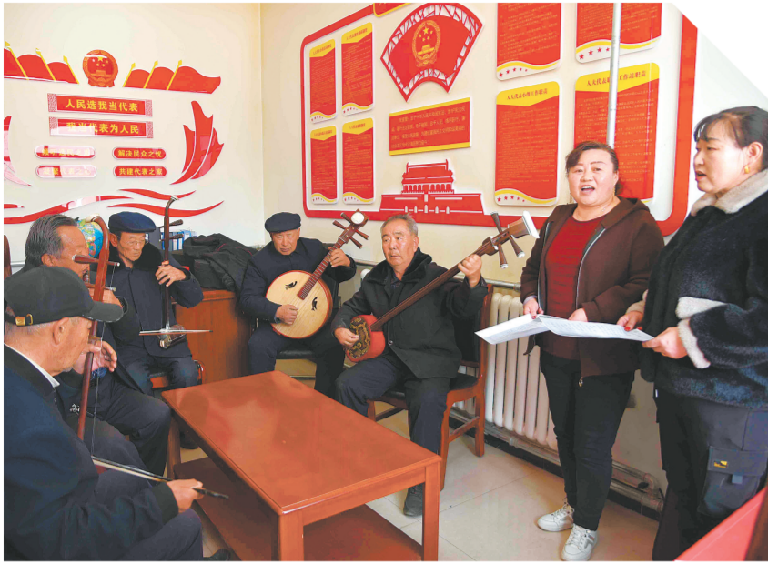
西宁市湟源县巴燕乡下胡丹村“柳叶青”曲艺队唱响政策“好声音”。