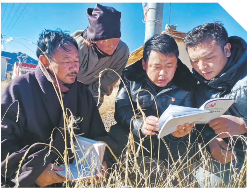
果洛藏族自治州久治县白玉乡龙格村村干部在牧民冬季草场宣讲党的二十大精神 and 中央一号文件精神。