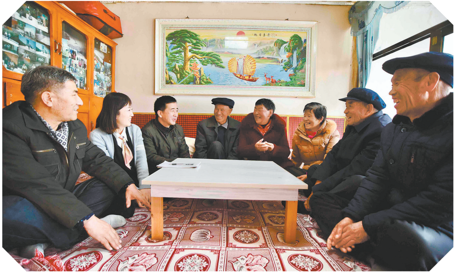
海东市乐都区中岭乡甘沟脑村下乡干部正在用通俗易懂的语言宣讲中央一号文件精神。