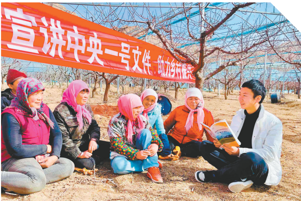
海南藏族自治州贵德县河阴镇抽调第一书记深入基层一线，以解决民生实事为目标，深入开展“一讲两稳三促四落实”宣讲活动。