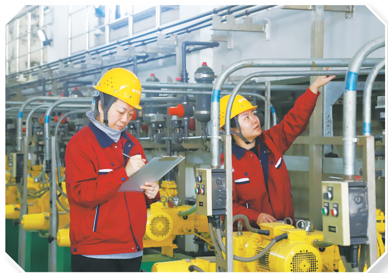
巡检水厂设施设备。