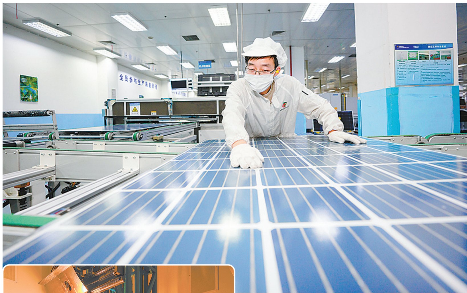
黄河水电光伏板生产车间。