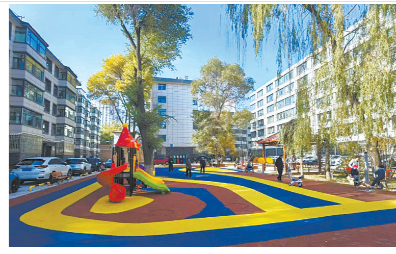
老旧小区改造增强居民幸福感。