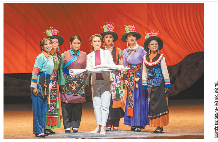
丰富多彩的文化活动让百姓生活更有滋味。