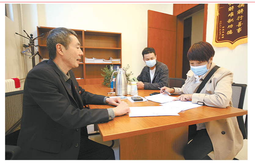
工作人员了解群众诉求。