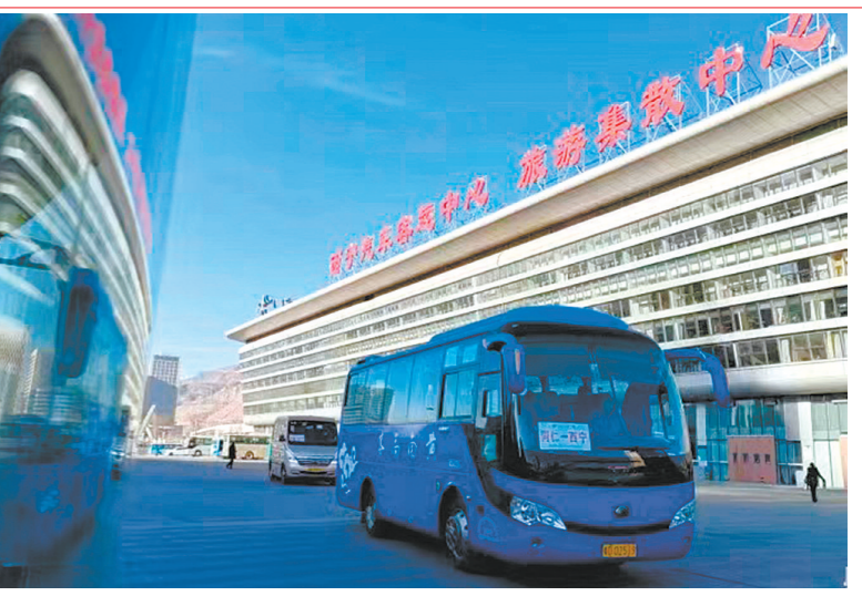
西宁汽车客运中心。