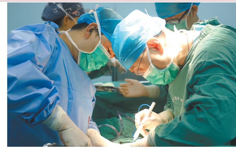
基层医疗服务能力不断提升。