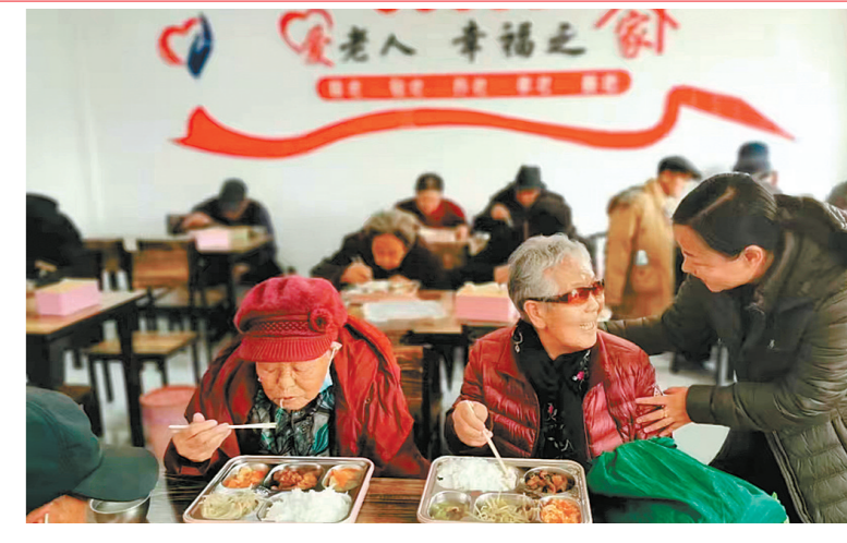
老年人在爱老幸福食堂就餐。资料照片