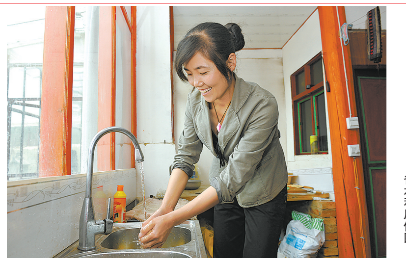
互助供水进房。省水利厅供图