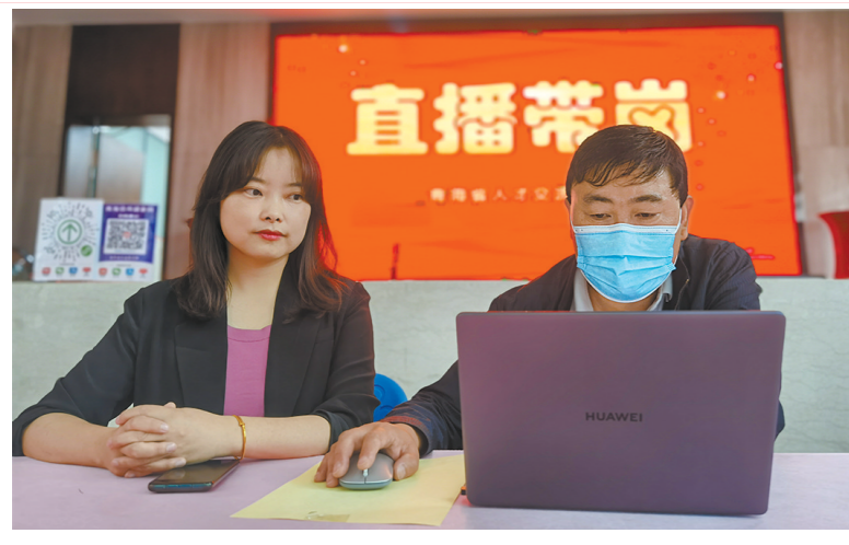
直播带岗工作人员介绍岗位。