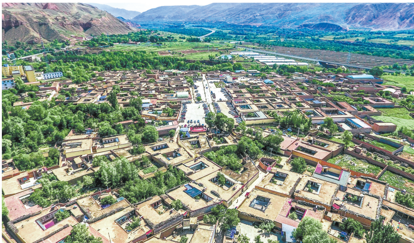
在大力推进乡村建设的几年里，保安镇乡村从地下管网到村庄外貌都发生了翻天覆地的变化。