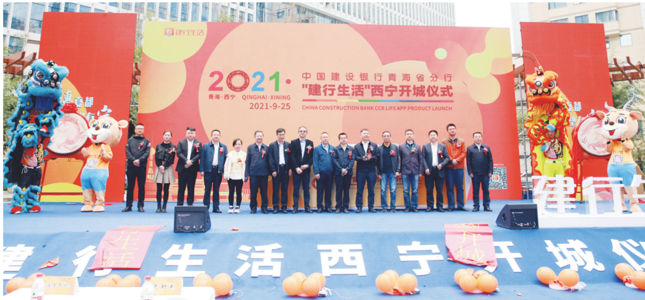
技术赋能实现公租房全省“一网统管”。

2017年至2022年，省分行布局住房租赁平台上线，覆盖全省两市六州；海东市和海西蒙古族藏族自治州政府公租房平台、西宁市企业租赁服务管理系统、西宁市和海州市住房租赁监管服务平台相继上线；研发统一的房屋交易系统，创新公租房系统“扫码支付”“公租房+裕农通”服务模式，科