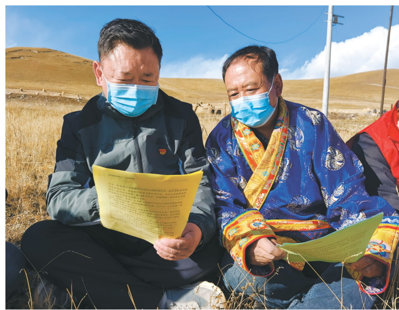
乡干部向群众讲解党的二十大精神。